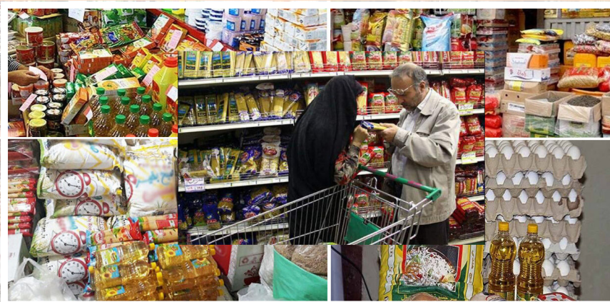
مدیر جهاد کشاورزی خبر داد: